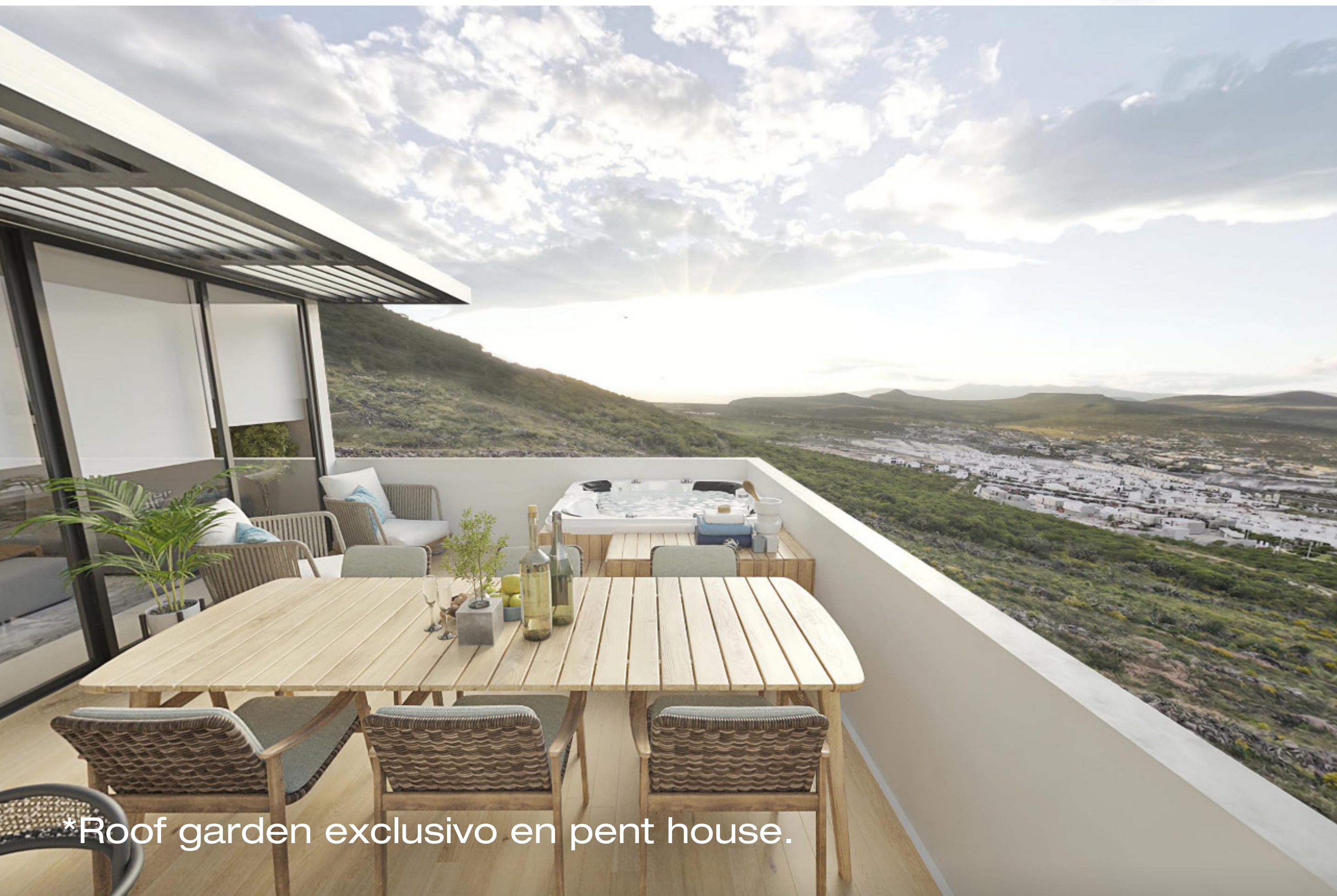
*Roof garden exclusivo en pent house.